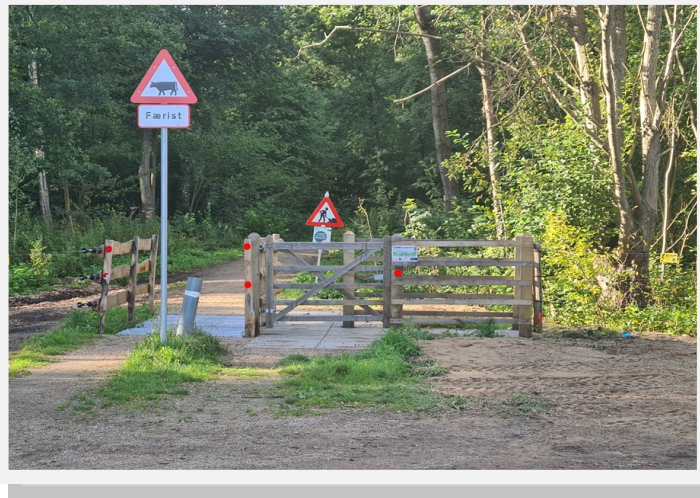
Indgang til Kohaveskoven.

Hjemmeside - http://www.sct-georg-odense.dk/4-sct-georg-gilde/