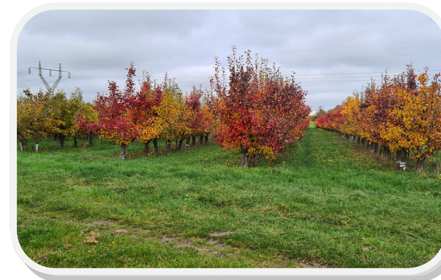
Pærer plantage i efterårsfarver

Hjemmeside - http://www.sct-georg-odense.dk/4-sct-georg-gilde/